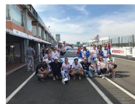
24 horas Ford