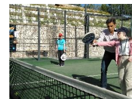
Torneo de Pádel